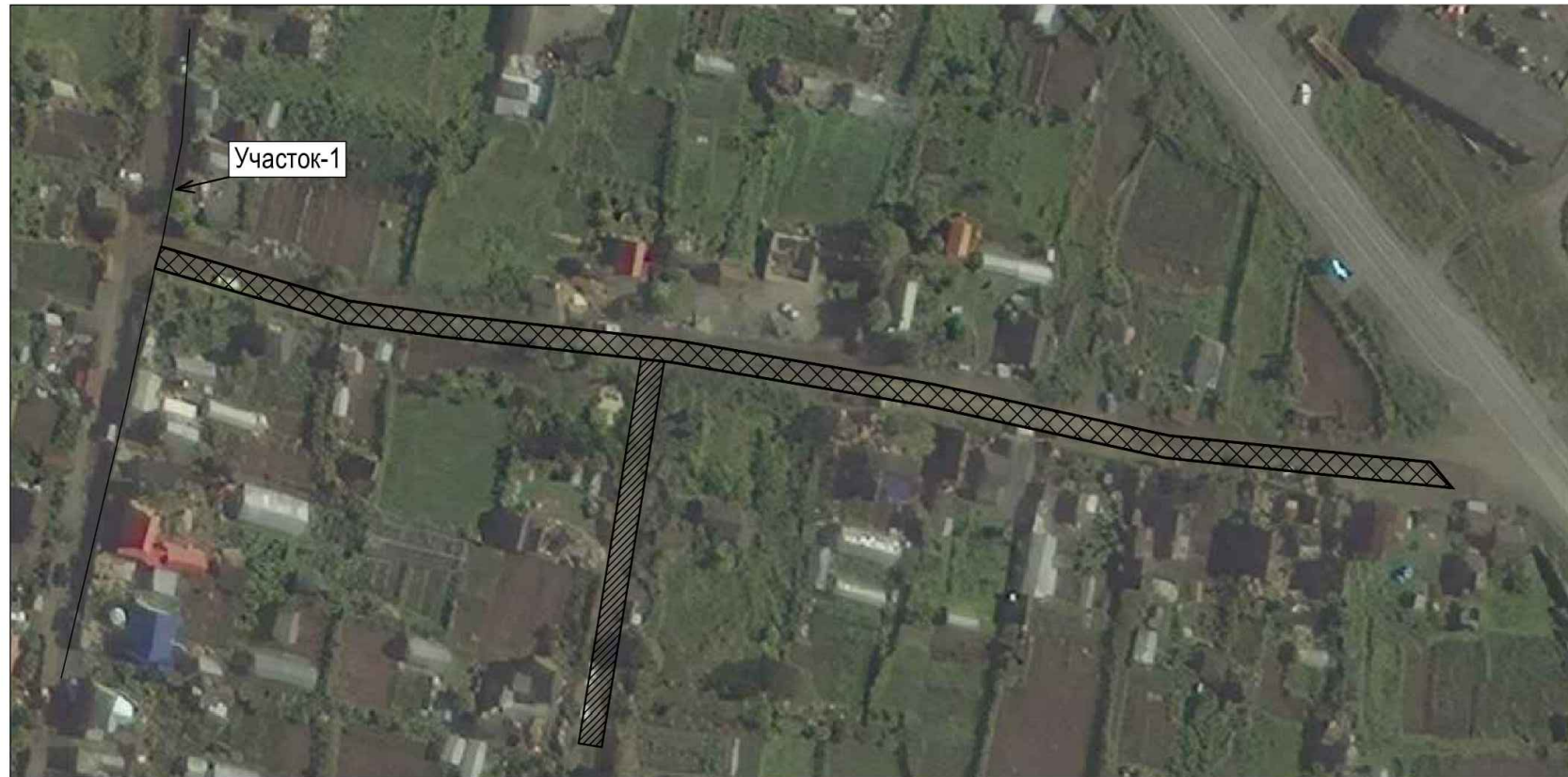
Схема расчистки ул. Центральная (Участок №2)