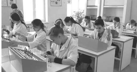
Региональный этап всероссийской олимпиады школьников по химии

В Вилючинске состоялось торжественное награждение победителей и призёров муниципального этапа Всероссийской олимпиады школьников. Чествование юных дарований проходило в МБОУ «Средняя школа №9». Актовый зал учебного заведения с трудом вместил то огромное количество детей, которые показали лучшие результаты на городском уровне.