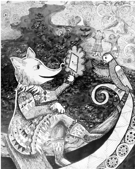
Арабина Вика, «Почему у дятла праздничная кушанка»

Рисунки выполнены тушью. Это довольно сложная техника, и тем интереснее: ведь надо, используя только чёрный цвет, на белом листе создать чёткую, графичную композицию. Результатом кропотливого труда явилась выставка «Нарисую сказку», которая проходит в библиотеке-филиале №5 п. Сельдевая.