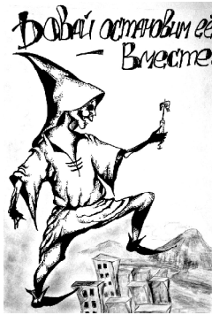
Рисунок Ани Щербининой