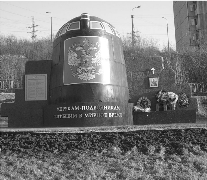
Памятник в Мурманске подводникам, погибшим в мирное время.

Закрытие «Дней туризма» состоится 20 октября.